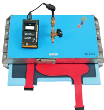
strumento di calibrazione trublü®

Grazie all'impiego del dispositivo di calibrazione trublü®, tutti i sensori del sistema pedar® vengono calibrati singolarmente utilizzando una pressione ad aria nota. Questa procedura è computerizzata e può essere eseguita in breve tempo.