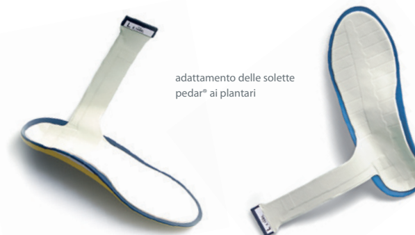
adattamento delle solette pedar® ai plantari